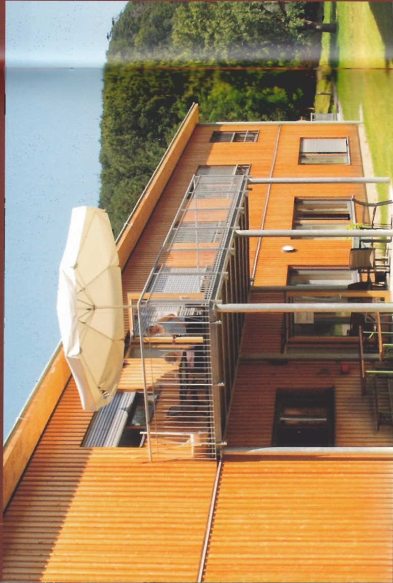
Bildschweini © Architekt DI Johann Konvicka